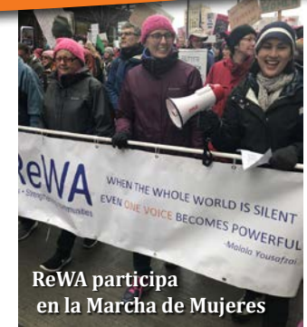
ReWA participa en la Marcha de Mujeres

Para patrocinar o participar en nuestros eventos, envía un correo electrónico a development@rewa.org .