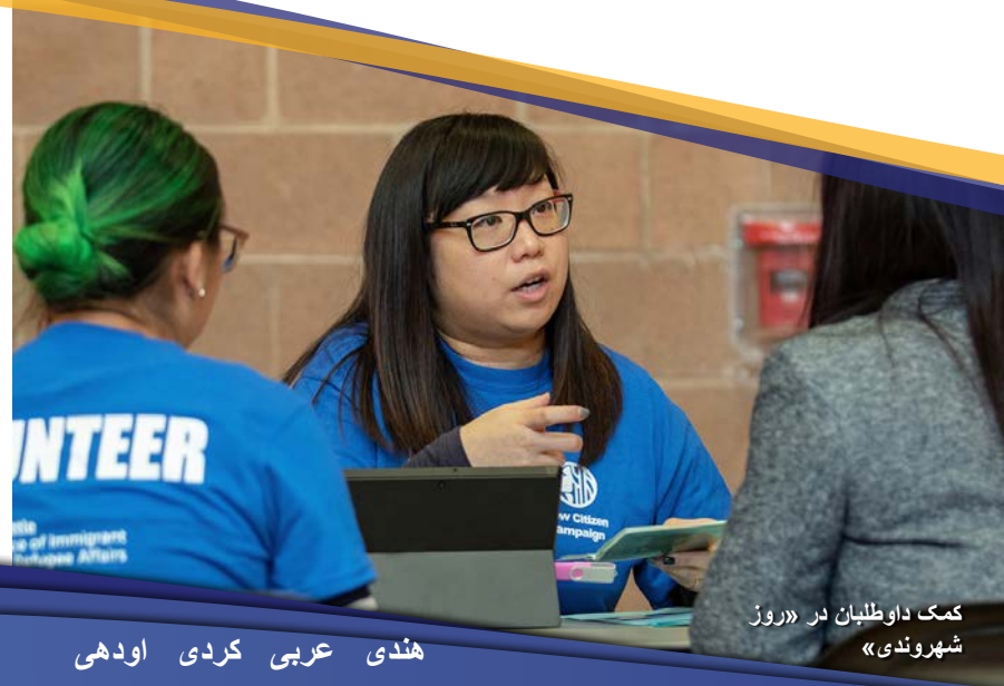
کمک داوطلبان در «روز شهروندی»