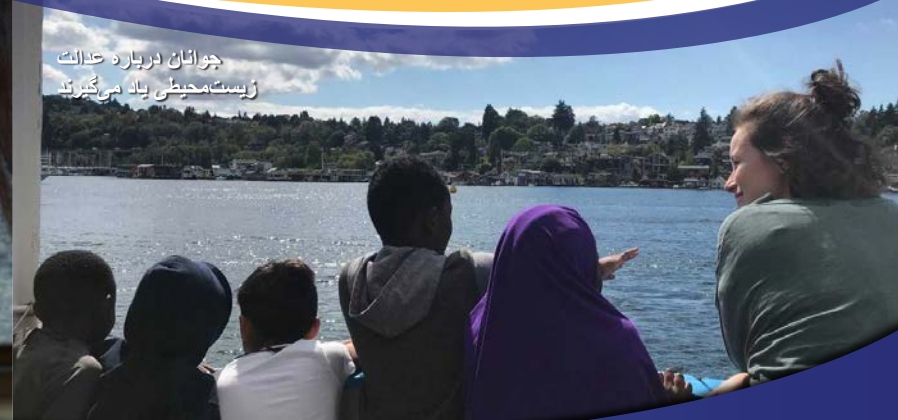
چراغان درباره عدالت زیست‌محیطی یاد می‌گیرند

سومالیایی اورومو امهری برمه‌ای نیپالی تیگرینیا سواحیلی ماندارین ویتنامی تاگالوگ فارسی اردو