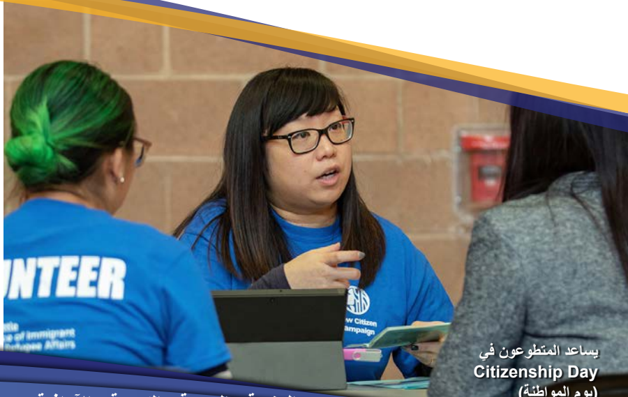
يساعد المتطوعون في Citizenship Day (يوم المواطنة)