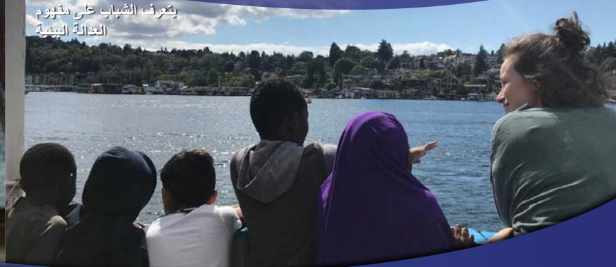
يتعرف الشباب على مفهوم العدالة البيئية

الصومالية الأوروبية الأمريكية البورمية النيبالية التبغرينغية السواحيلية الماندرينية الفيتنامية التاغالوغية الفارسية الأردية