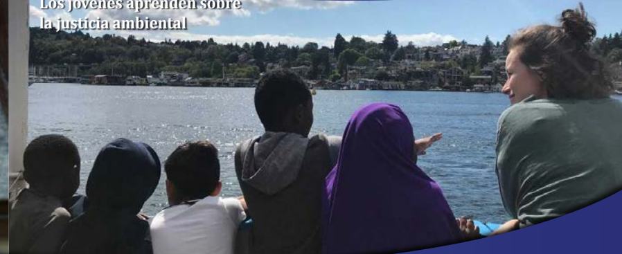
Los jóvenes aprenden sobre la justicia ambiental