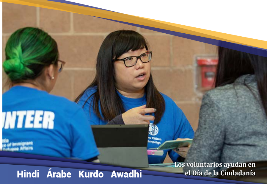
Los voluntarios ayudan en el Día de la Ciudadanía

Los donantes individuales que contribuyen directamente con ReWA aportan la flexibilidad para responder a las necesidades de nuestros clientes a medida que surgen. Los donantes se actualizan durante todo el año y se les invita a nuestros eventos especiales. A través de las campañas en las redes sociales y los programas de contribuciones de los empleados, nuestros donantes han superado el doble sus abundantes inversiones y, a su vez, concientizan sobre el trabajo que realizamos. Para obtener más información, visita www.rewa.org/get-involved .