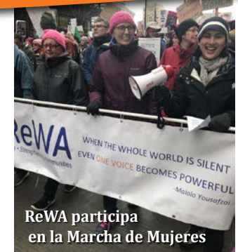
ReWA participa en la Marcha de Mujeres

Para patrocinar o participar en nuestros eventos, envía un correo electrónico a development@rewa.org .