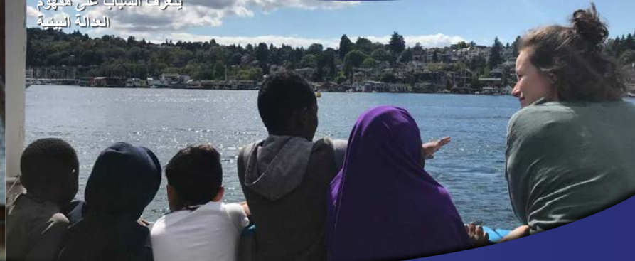
يتعرف الشباب على مفهوم العدالة البيئية

الصومالية الأوروبية الأمريكية البورمية النيبالية التبغرينغية السواحيلية الماندرينية الفيتنامية التاغالوغية الفارسية الأردية