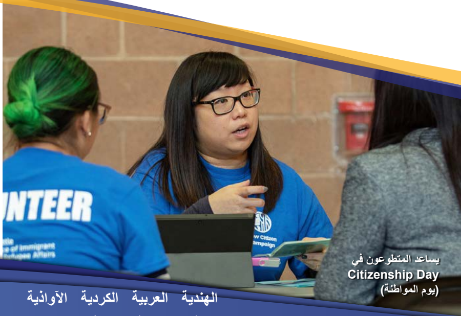
يساعد المتطوعون في Citizenship Day (يوم المواطنة)